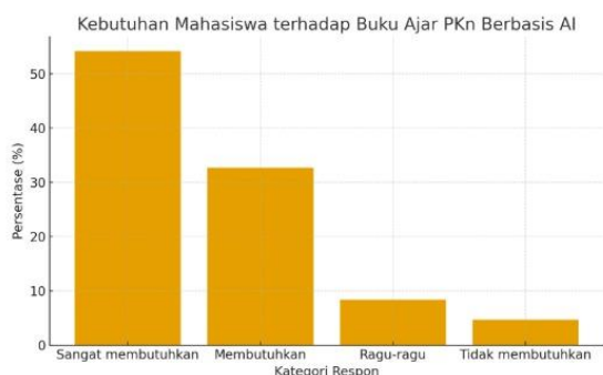
Grafik 1. Grafik Kebutuhan Mahasiswa terhadap Buku Ajar PKn Berbasis AI (n = 107)

Selain kebutuhan umum, mahasiswa juga mengidentifikasi aspek-aspek spesifik yang diperlukan dalam buku ajar berbasis AI. Sebanyak 82% mahasiswa menginginkan buku ajar yang menyediakan fitur pembelajaran adaptif, 78% menginginkan integrasi studi kasus berbasis digital citizenship, dan 74% mengharapkan keberadaan umpan balik otomatis dari sistem AI. Sementara itu, 69% mahasiswa menilai perlunya penyediaan materi mengenai etika penggunaan AI dan analisis disinformasi untuk memperkuat kemampuan berpikir kritis.