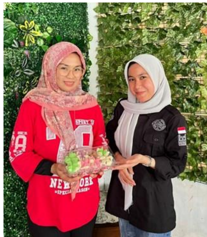
Gambar 3. Dokumentasi Verifikasi Produk UMKM sebagai Bagian dari Proses Sertifikasi Halal

Gambaran proses verifikasi produk UMKM sebagai bagian dari tahapan sertifikasi halal disajikan pada Gambar 3 .